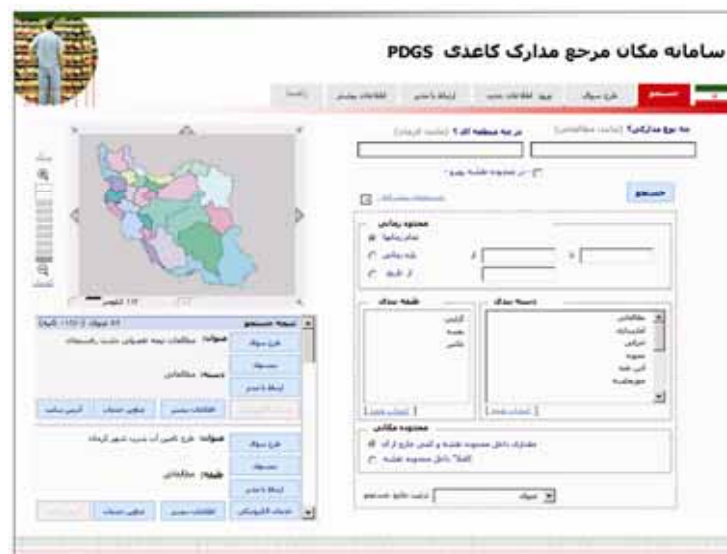
ماکت سامانه مکان مرجع مدارک کاغذی PDGS